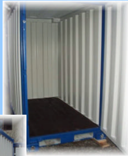
Seecontainer - in allen Grössen